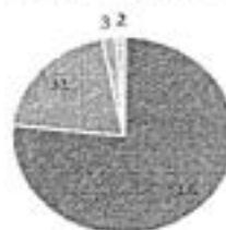
Kezelt Társasházak megoszlása 2019.12.31-én

* 2-9 albetétként • 10-59 albetétként • 60-100 albetétként • 100 albetétként